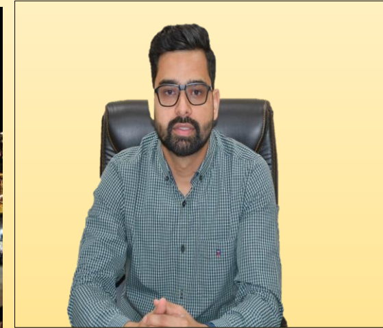
Shri Jag Pravesh (IAS) Municipal Commissioner